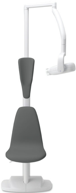
Modèle iX-R avec fauteuil patient