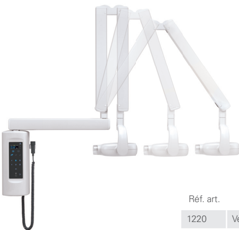
Modèle iX-WA à montage mural